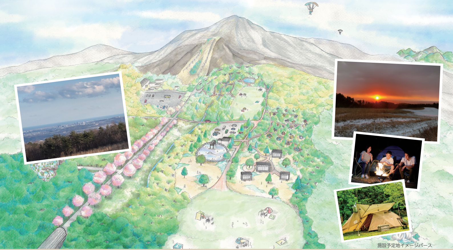
施設予定地イメージパース

古くから仙台市民に愛されてきた泉ヶ岳。 この度この地に新しくできるキャンプ場の名称を 市民の皆様から募集します!