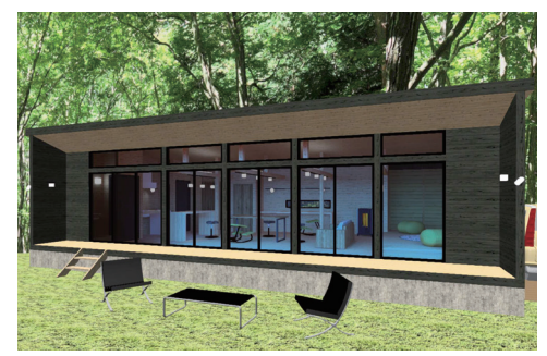
コテージイメージパース

(仮称) 泉ヶ岳キャンプ場名称公募事務局 ✉ izumigatake.koubo@gmail.com