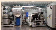
← 木質バイオマスガス化熱電併給ユニット (CHP)